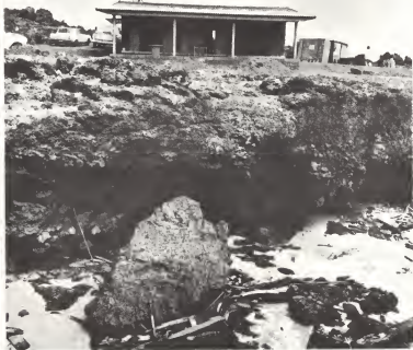
Vista di pafu di e Snackbar.